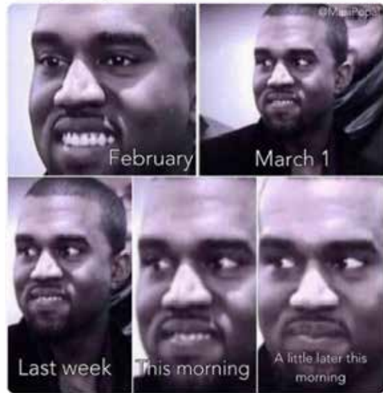
Рис. 1, 2. Прагматичний вплив мемів на суспільну свідомість і поведінку