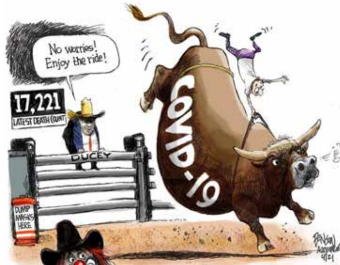
Рис. 11. Прагматичний вплив мемів на суспільну свідомість і поведінку

зокрема ключові терміни, пов'язані з пандемією та її соціальними наслідками, які домінують у меметичному контенті і підкреслюють актуальність теми. Неологізми, скорочення та сленгові вирази додають мемам емоційного насичення і гумористичного вираження, сприяючи формуванню специфічної культурної реакції на кризову ситуацію. Стилiстичний аналіз виявляє, як мовні та образні засоби в мемах використовуються для досягнення різних ефектів на аудиторію, акцентуючи теми, такі як носіння масок, соціальна дистанція та критика управління пандемією. Більшість науковців вважають, що розважальна функція є основною для мемів (Смола, 2019: 92) проте безсумнівно вони також висловлюють психологічні, етичні, політичні та побутові проблеми. Мемам притаманна низка функцій, таких як інформативна, самоідентифікаційна, експресивна, оцінювальна тощо. Їх прагматика включає також встановлення міжкультурного спілкування, що можливе завдяки використанню англійської мови як мови міжнародного спілкування. Це дозволяє обміну мемами між користувачами з різних культур, інтегруючи їх у глобальну інтернет-культуру.