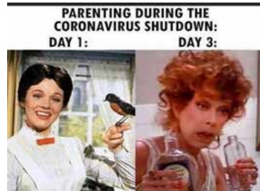
Рис. 3, 4. Лексичне наповнення мемів про COVID-19

Лексика мемів про COVID-19 також охоплює економічні аспекти кризи. Слово «economy» підкреслює економічні наслідки пандемії, що впливають на фінансовий стан населення. Інші важливі слова, як-от «government» і «corrupt industry», вказують на критику політичних рішень і дій окремих індустрій. У деяких мемах використовуються математичні терміни «Linear Scale» і «Logarithm Scale» (рис. 7), що дозволяють візуально порівнювати статистичні дані про поширення вірусу, підкреслюючи науковий підхід до аналізу та презентації даних.