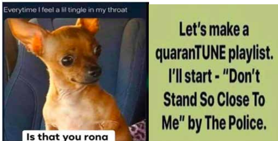
Рис. 8, 9. Представлення мемів COVID-19 за допомогою неологізмів