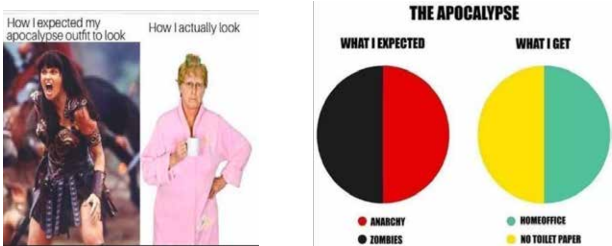
Рис. 5, 6. Асоціативне представлення COVID-19