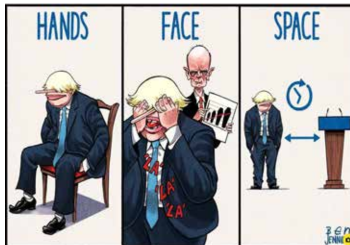
Рис. 10. Представлення COVID-19 через PPE лексему

у карикатурній манері, сидячи на стільці з руками під собою, що є візуальною метафорою ідіоми «to sit on your hands» (буквально «сидіти на руках», що означає бездіяльність). Друга частина «Face» показує Джонсона, який закриває обличчя руками, демонструючи небажання звертати увагу на негативну статистику. У третій частині «Space» висловлюється думка про управління Джонсоном країною: він стоїть на значній відстані від трибуни, ніби дотримуючись соціальної дистанції, і таким чином не впливає на політичне життя.