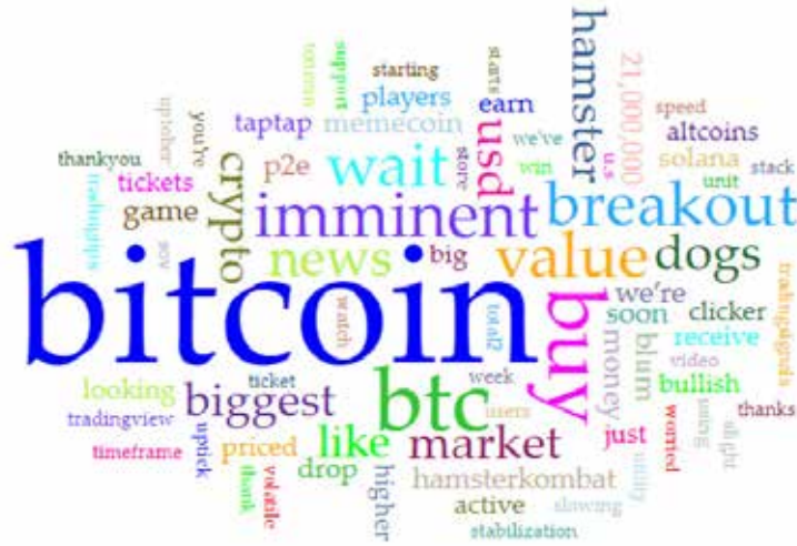
Рис. 1. Частотність лексем у X

відображено на рис. 2. Співставлення ключових слів із темами дає уявлення про основні тенденції інформаційного насичення контенту.