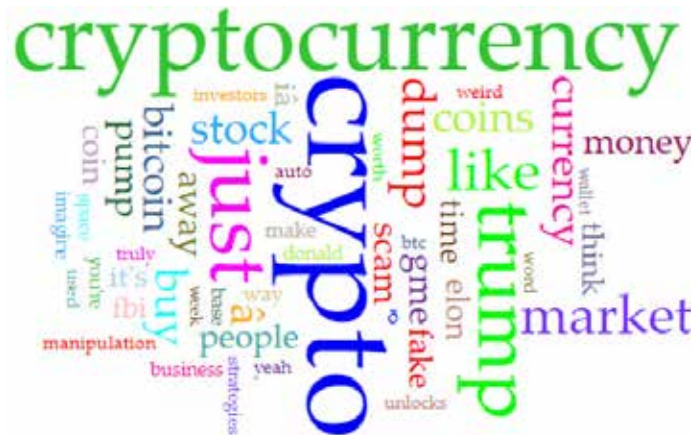
Рис. 3. Частотність лексем у Reddit