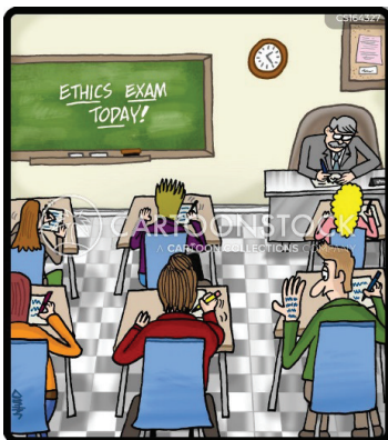
Рис. 8. Шпаргалка на долоні

Рис. 9 передає діалог між вчителькою і учнем, який несамостійно виконав завдання. Для того, щоб зрозуміти хід думок і логіку міркувань учня, педагог звертається до нього зі словами: “You have to not only show your answer, you have to show how you got your answer” (Ви повинні не лише показати свою відповідь, ви повинні показати, як ви отримали відповідь), на що хлопець відповідає: “I looked over Brad’s shoulder like this” (Я зазирнув через плече Бреда ось так) і витягує шию, щоб показати, як саме він списував в однокласника.