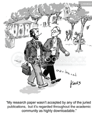
Рис. 1. Публікаційна етика

paper wasn't accepted by any of the juried publications, but it's regarded throughout the academic community as highly downloadable” (Мою наукову статтю не прийняло жодне рецензоване видання, хоча академічна спільнота вважає, що її можна швидко завантажити). З метою підтримки доброчесності та високої якості наукових публікацій, всі учасники публікаційного процесу – члени редколегії, автори, рецензенти, видавці та заклади, задіяні у видавничому процесі – зобов'язані дотримуватися етичних стандартів, норм та правил. Автори статті повинні забезпечувати новизну, достовірність і оригінальність результатів дослідження і подавати до редакції рукописи, які раніше не публікувалися (Публікаційна етика). Видавництво має право відхилити статтю, оскільки відповідно до правил, прийнятих у журналі, оприлюднення статті в інтернеті вважають публікацією.