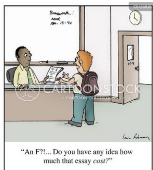
Рис. 4. Купівля наукової роботи

Підпис під рис. 4 вказує на сильне обурення учня з приводу незадовільної оцінки (F) за есе. Пунктуаційні знаки, які передають на письмі емоції, надають висловлюванню експресивності. Учень не може змиритися з тим, що есе, яке він замовив за чималу суму, так низько оцінено: "An F?!... Do you have any idea how much that essay cost?" (Незадовільно?!... Ви хоч уявляєте, скільки коштує це есе?). Подання домашнього завдання, виконаного на замовлення іншою особою як власного, є різновидом академічного плагіату (Юрко,