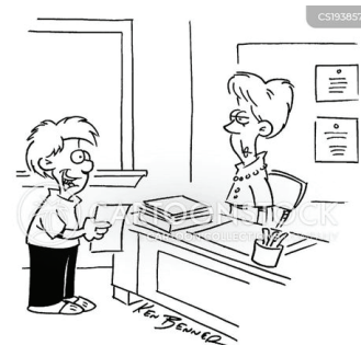
Рис. 5. Авторство під сумнівом

"To be environmentally responsible I'm recycling my sister's old book reports."