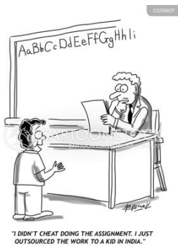
Рис. 3. Академічна робота на замовлення

На рис. 3 бачимо вчителя і здобувача освіти, який каже: "I didn't cheat doing the assignment. I just outsourced the work to a kid in India" (Я не обманював, виконуючи завдання. Я просто замовив цю роботу у хлопця з Індії). Учень вкрай здивований, на що вказують його широко відкриті, округлені очі. Не менш здивований і вчитель, коли почув таку відповідь, як це видно з його міміки.