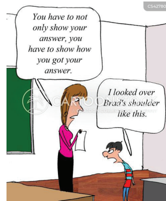
Рис. 9. Несамостійне виконання завдання

На рис. 10 зображено вчительку й учня, який отримав незадовільну оцінку (F) за виконане завдання. Учень висловлює своє обурення оцінкою, оскільки він переконаний, що завдання виконане правильно, бо він все списав з інтернету: “Whaddya mean all my facts are wrong?!? I copied everything straight off the internet!!” (Це означає, що всі мої факти неправильні?!? Я скопіював усе прямо з інтернету!!). Міміка учня, зокрема широко відкритий рот, і окличні речення вказують на те, що учень дуже розгніваний. Він не розуміє, за що йому поставили таку низьку оцінку.