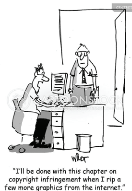
Рис. 2. Порушення авторського права

Рис. 2 демонструє двох науковців, один з яких пише про порушення авторських прав і визнає, що збирається завантажити ще кілька рисунків з інтернету без дозволу на те їх автора: “ I'll be done with this chapter on copyright infringement when I rip a few more graphics from the internet” (Я закінчу з цим розділом про порушення авторських прав,