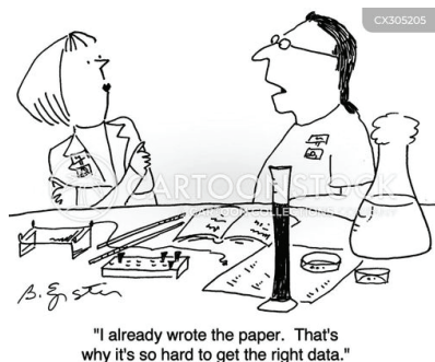
Рис. 11. Фабрикація результатів наукового дослідження

Висновки. Шляхом синтезованого поєднання зображальної та вербальної складових, карикатура як художнє явище розкриває різні види академічної недоброчесності, яка є однією з головних проблем в академічному середовищі. Перебільшені риси та гротескні образи в карикатурі роблять академічну недоброчесність не лише аморальною, але й кумедною, що забезпечує їй доступність для широкої аудиторії. Зміст повідомлюваного експліковано через взаємодію вербальних та невербальних компонентів. Вербальні компоненти через підписи і словесні бульбашки пояснюють, що зображено. Знаки пунктуації (знак оклику і знак питання) надають повідомлюваному емоційно-експресивного забарвлення. Міміка і жести персонажів допомагають декодувати їхні емоційні стани.