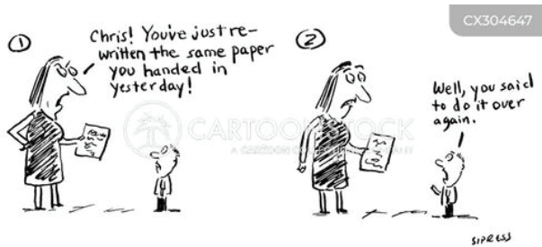
Рис. 7. Повторне використання власної роботи

Порушенням академічної доброчесності є самоплагіат. З діалогу між вчителькою і учнем на рис. 7 випливає, що учень двічі здав одну й ту саму роботу: “Chris! You’ve just re-written the same paper you handed in yesterday!” (Кріс! Ви просто переписали ту саму роботу, яку здали вчора!) – “Well, you said to do it over again” (Ну, Ви сказали зробити це ще раз). Таким чином учень обманув вчительку, яка очікувала на доопрацьовану роботу.